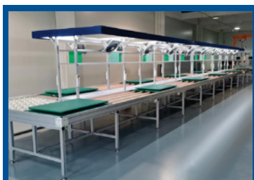
Неавтоматизированная сборочная линия