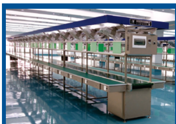
Конвейерная сборочная линии