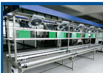
Двусторонняя автоматизированная сборочная линия