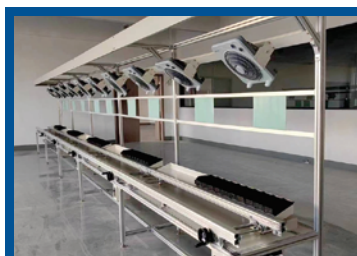
Односторонняя автоматизированная сборочная линия