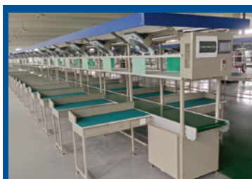
Сборочная линия со столами монтажников