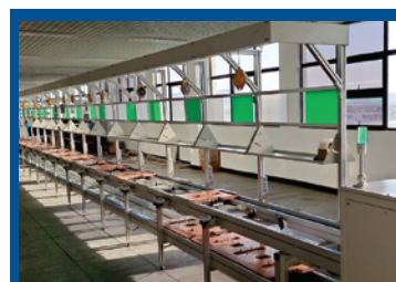
Двухъярусная автоматизированная линия